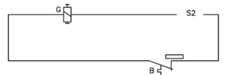
Ochranný obvod proti haseniu plameňa.

B- termostat; G- Integrovaný solenoidový ventil v ochrannom obvode proti zlyhaniu plameňa; M- motor ventilátora; Q - vypínač; Q2-zapaľovanie; S- zapaľovacia ihla, S2- termočlánok; Y-solenoidový ventil; C-kondenzátor